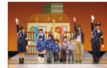
親と子の交通安全ミュージカル