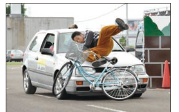
生徒向け自転車交通安全教室